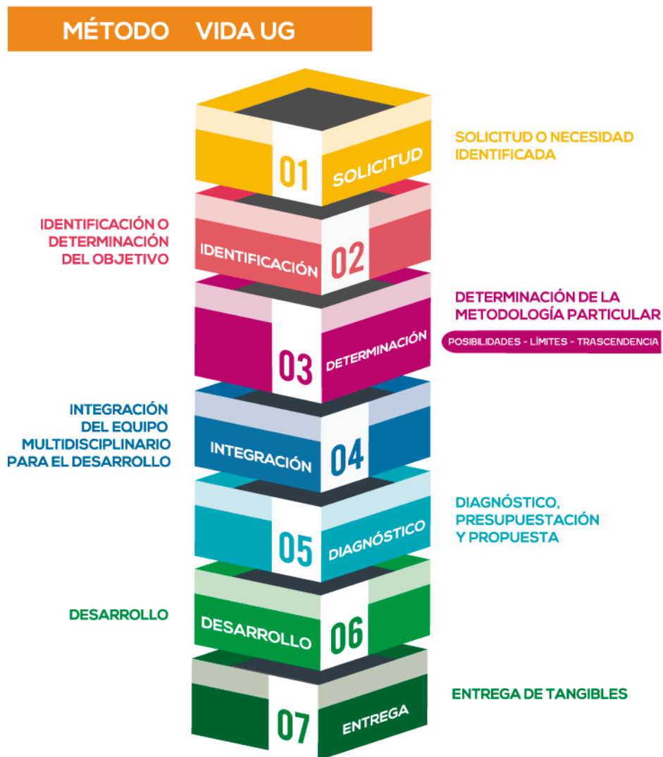
Esquema 2: Método VIDA UG

El Método VIDA UG se define como el procedimiento natural que debe seguirse por cada persona que colabore en el Ecosistema de Vinculación, Innovación, Desarrollo y Aplicación del Conocimiento de la Universidad de Guanajuato, quien debe privilegiar el enfoque sistémico y creativo con la flexibilidad ante una idea o proyecto ingresado para elegir una metodología propia para cada uno, tras identificar necesidades, objetivos, impactos y alcances.