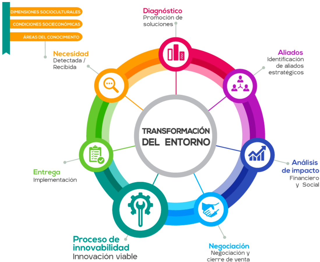
Esquema 1: Proceso de Innovabilidad

Se ha construido un proceso propio de Innovabilidad , como herramienta para desarrollar en el talento universitario la habilidad para generar innovación viable. Definido como un ciclo que parte de una necesidad detectada por algún actor interno o externo, identificada con base en dimensiones socioculturales, condiciones socioeconómicas y áreas del conocimiento, donde el objetivo central es encontrar la estrategia de transformación del entorno que la resuelva, pasando por distintas etapas, comenzando por el diagnóstico; la identificación de aliados estratégicos, el análisis de impacto, la negociación, el desarrollo del Proceso de innovación viable, y la implementación. En cada etapa, habrá un representante del talento universitario que a su vez dirigirá los esfuerzos con un enfoque de articulación de acciones y tareas de manera estratégica, localizada y armónica hacia el objetivo central.