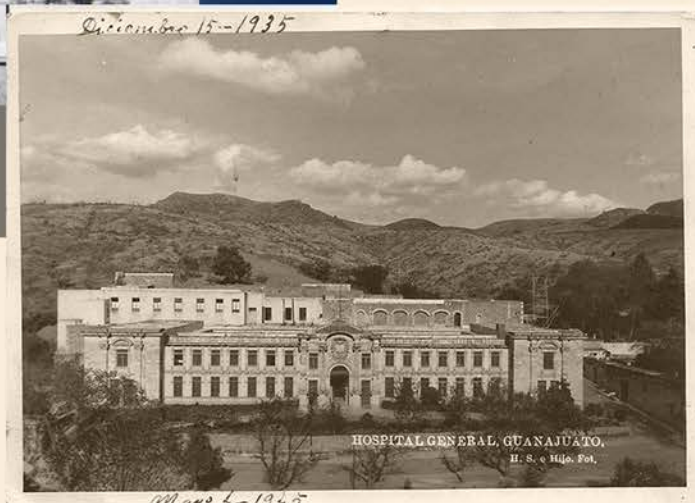
Imagen del Hospital General que en 1953 fue ocupado por la Escuela Normal, ya independiente de la Universidad de Guanajuato

DESTACADOS ESTUDIANTES Y PROFESORES PASARON POR LA ESCUELA NORMAL DE GUANAJUATO