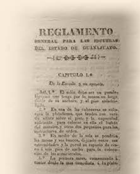
Reglamento General para las Escuelas del Estado de Guanajuato. 20 de agosto de 1831