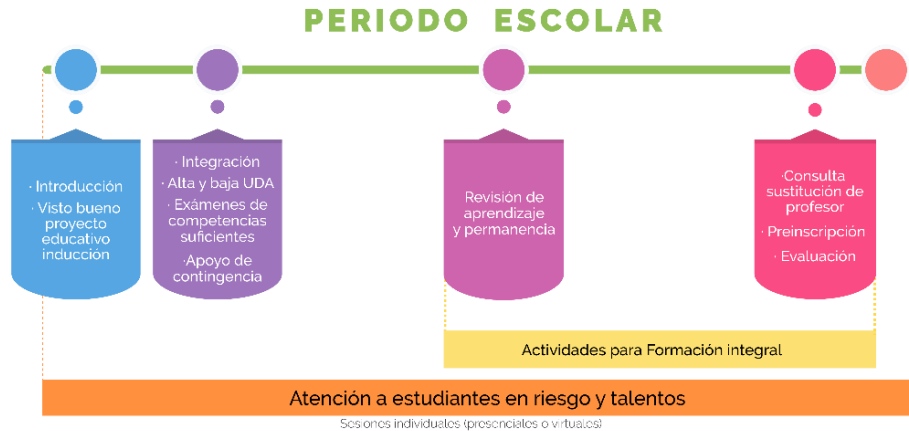
Figura 4. Proceso de tutoría académica

Actividades. En cada periodo escolar, la persona tutora convocará a tres sesiones, preferentemente grupales, a las personas tutoradas, para realizar actividades de inducción e integración, para atender los procesos establecidos en el Reglamento Académico, y para la revisión de la permanencia y el avance en sus UDA; y finalmente, para evaluar la actividad tutorial realizada en el periodo, así como para orientar en el proceso de pre - inscripción de UDA. Se realizarán sesiones individuales para atender los procesos establecidos en el párrafo anterior, debiendo priorizar la atención del estudiantado que el sistema de alertas 2 identifique en las categorías de riesgo, tercera oportunidad o talentos (Ver figura 4).