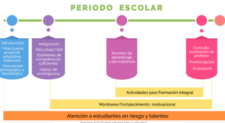
Figura 5. Proceso de tutoría académica en modalidad abierta

En el acompañamiento de personas tutoradas que participen en programas educativos en modalidad a distancia, se incorporan las actividades de brindar orientación pedagógica y tecnológica al inicio del periodo escolar, así como el monitoreo y el reforzamiento de las condiciones motivacionales para favorecer el aprendizaje (Ver figura 5).