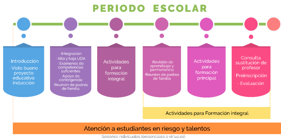
Figura 6. Proceso de tutoría académica en Nivel Medio Superior

Particularmente para el Nivel Medio Superior, se abordarán las actividades ya descritas para esta estrategia de acompañamiento, incorporando adicionalmente actividades formativas descritas en las UDA de acompañamiento establecidas en el programa educativo, las cuales se integran en el horario de actividades del estudiantado (Ver figura 6).