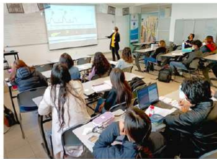
Fotografía en salón de clase en mayo de 2023

En línea en tiempo real: interactúa en el momento con el grupo, profesores y profesoras en el aula.