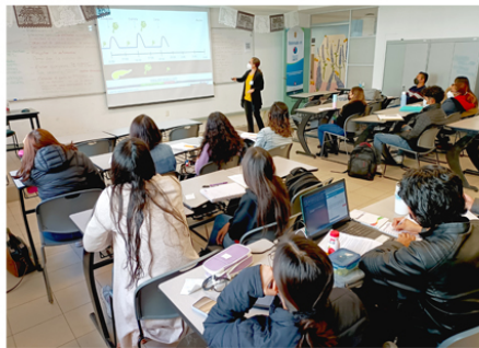
Fotografía en salón de clase en mayo de 2023

En línea en tiempo real: interactúa en el momento con el grupo, profesores y profesoras en el aula.