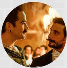
EL BAILE DE LOS 41 MAYO 02