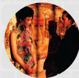
IN THE MOOD FOR LOVE FEBRERO 14