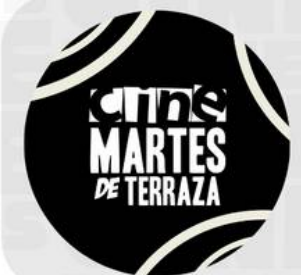
CONMEMORACION LO MEJOR DEL CINE MAYO 16 - 19