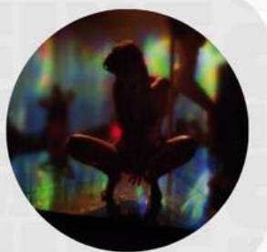
ENTER THE VOID MARZO 28