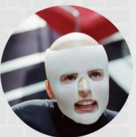
LA PIEL QUE HABITO MAYO 30

Etiquétanos a través de Instagram #MartesTocaCine