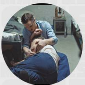
GROBE FREIHEIT MAYO 23