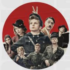
JOJO RABBIT ABRIL 25