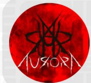
AURORA FESTIVAL MARZO 07