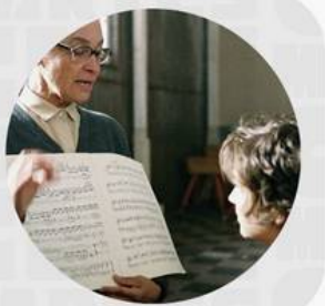
VIER MINUTEN MAYO 09