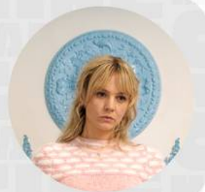
PROMISING YOUNG WOMAN FEBRERO 21