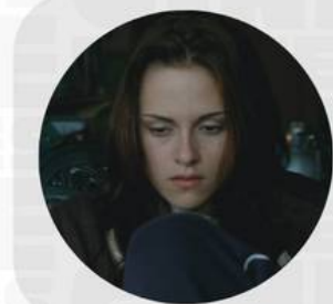
SAGA TWILIGHT FEBRERO 07-10