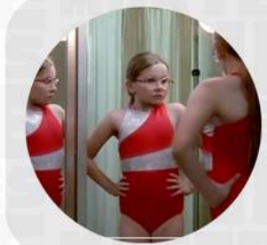
LITTLE MISS SUNSHINE ABRIL 18