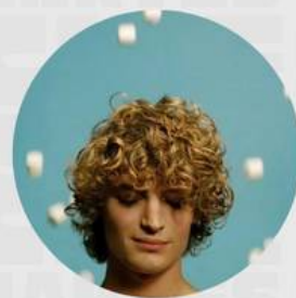
LES AMOURS IMAGINAIRES FEBRERO 21