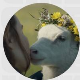
LAMB MARZO 14