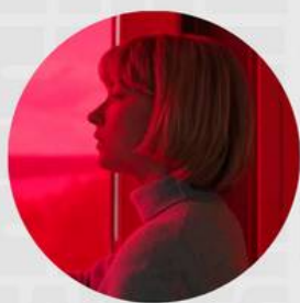
SWALLOW MARZO 21