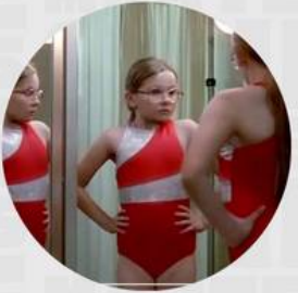
LITTLE MISS SUNSHINE ABRIL 18