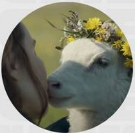
LAMB MARZO 14