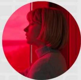
SWALLOW MARZO 21