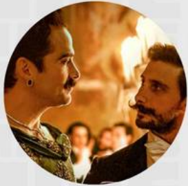
EL BAILE DE LOS 41 MAYO 02