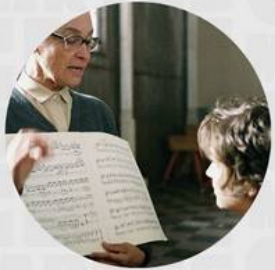
VIER MINUTEN MAYO 09