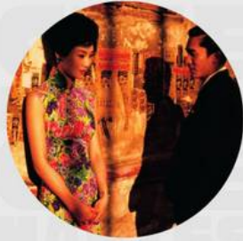
IN THE MOOD FOR LOVE FEBRERO 14