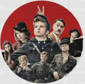
JOJO RABBIT ABRIL 25