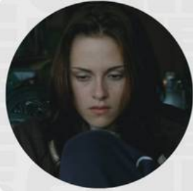
SAGA TWILIGHT FEBRERO 07-10