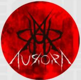
AURORA FESTIVAL MARZO 07