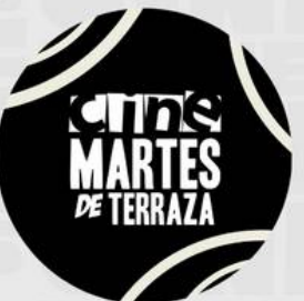
CONMEMORACION LO MEJOR DEL CINE MAYO 16 - 19