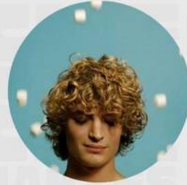
LES AMOURS IMAGINAIRES FEBRERO 21