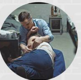
GROBE FREIHEIT MAYO 23