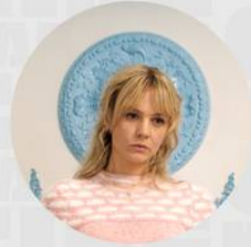
PROMISING YOUNG WOMAN FEBRERO 21