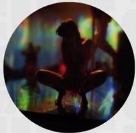
ENTER THE VOID MARZO 28