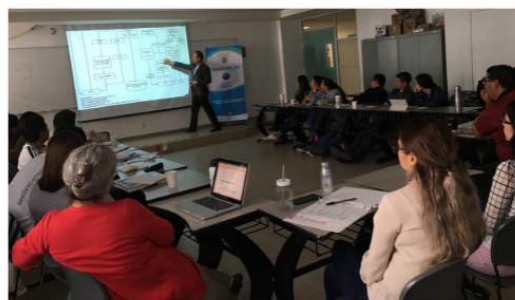
Foto de clase del grupo en junio de 2019

En línea en tiempo real. Interactúa en tiempo real con el grupo, profesores y profesoras en el aula