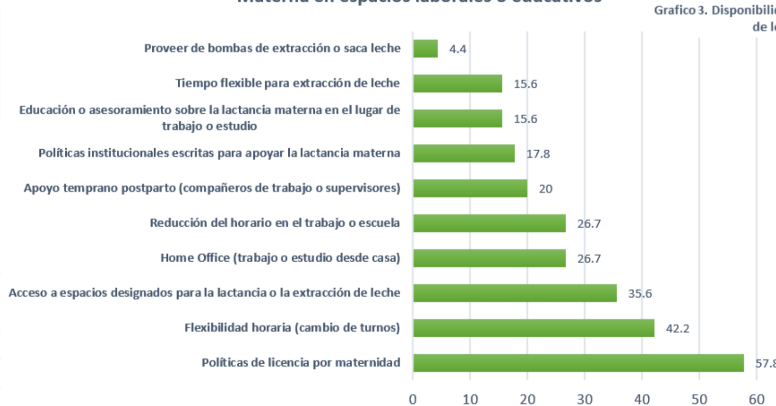
Gráfico 3. Disponibilidad de espacios designados para lactancia o extracción de leche en el lugar de trabajo o escuela.