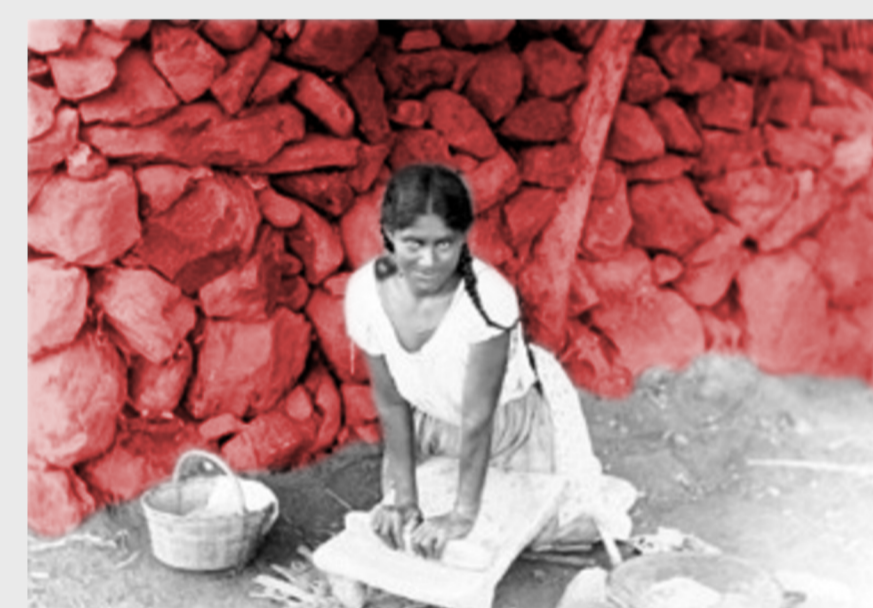
Figura 5. Acentos sobre Tortillera.