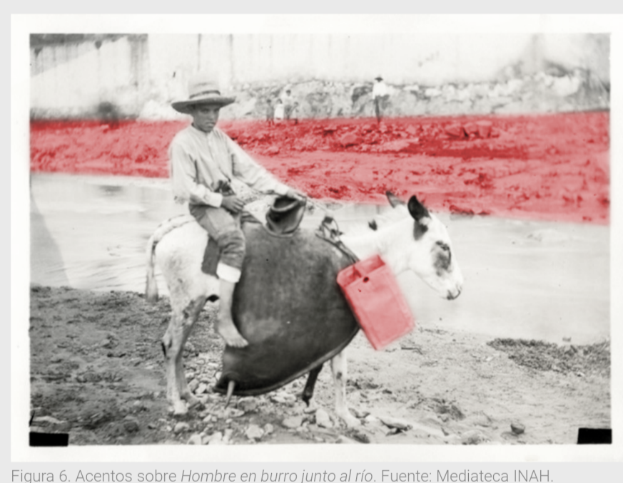
Figura 6. Acentos sobre Hombre en burro junto al río.