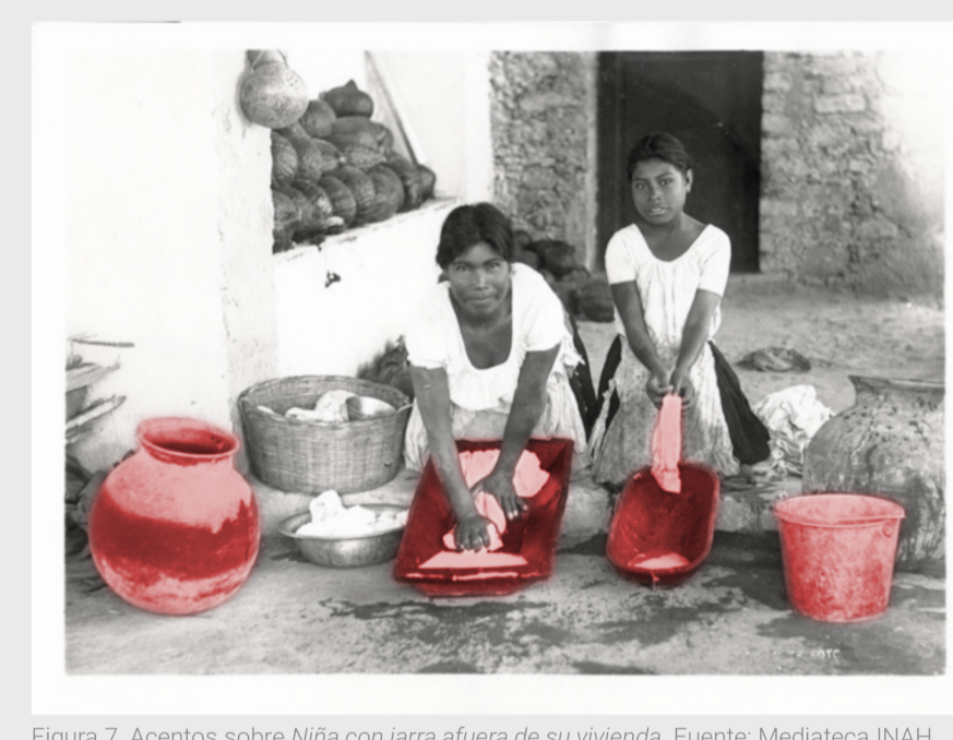
Figura 7. Acentos sobre Niña con jarra fuera de su vivienda.