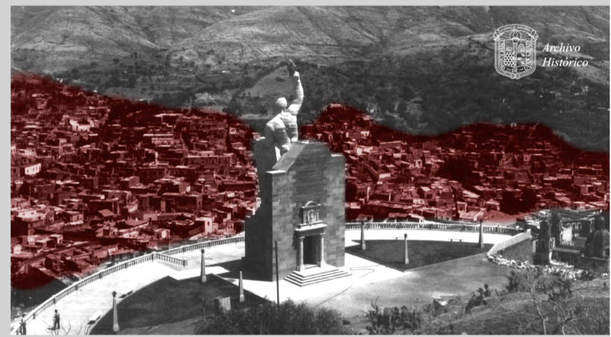
Figura 2. Acentos sobre Vista Panorámica desde el Píjaro.

Considerando que la evolución de un paisaje urbano histórico hasta su estado actual no es resultado de una sola línea de hechos históricos, sino del conjunto de factores sociales y naturales operando sobre el territorio con detonantes inmediatos o lejanos espacial y temporalmente; algunas características urbanas indeseables pueden haberse originado hace mucho tiempo e incluso haber sido parte inherente del paisaje urbano histórico durante siglos.