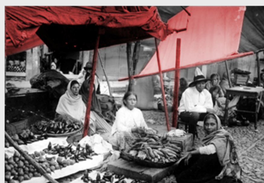
Figura 4. Acentos sobre Vendedoras de frutas.

Este material permitió admirar, estudiar y analizar de manera explícita épocas históricas, expresando detalles sobre la forma de vida de una sociedad, arquitectura, materiales, espacios, tecnología, el paso del tiempo y el cambio de las ciudades.