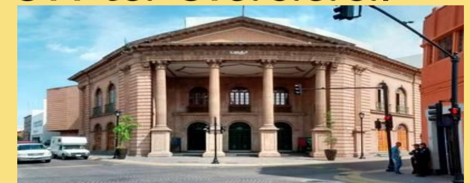
Galería Jesús Gallardo.

Nuestra investigación busca establecer formalmente el estado y desarrollo de las artes visuales en la región a través de la producción de crítica de arte y descifrar qué motivos han llevado al déficit en su manifestación como incentivo artístico.