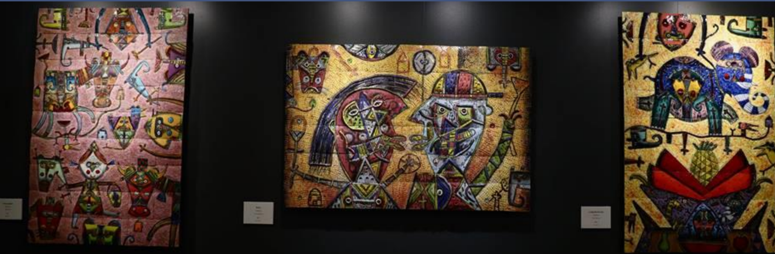
La imagen es de la galería Kunalá de la exposición «Los laberintos del color»

El proyecto de crítica de arte, tuvo como finalidad el análisis y la búsqueda de un conocimiento amplio, el cual ayudase a enriquecer el acervo cultural y científico de este tema, además de que sigue un marco teórico, por lo que se puede decir que su finalidad es de tipo aplicada. El fenómeno social que se analiza en este proyecto tiene como objetivo principal el análisis actual de la crítica de arte, por lo que es de tipo sincrónico. Su amplitud es monotemática, puesto que, se basa en un tema central, crítica de arte. Como se comentó en el aparato crítico, nos apoyamos en la recaudación de textos, en la realización de entrevistas para este proyecto, por lo que, según sus fuentes es del tipo mixta. La metodología de este proyecto se basó en primera instancia en la observación del fenómeno, para posteriormente analizarlo y finalmente dar conclusiones de lo que observó y analizó, por lo que su metodología es del tipo cualitativa. El marco de investigación es de campo, y es un informe de caso porque analiza una situación en específico, en un espacio-tiempo bien determinado