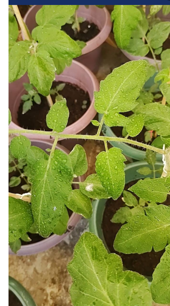
Figura 1. Aplicación de nanopartículas de quitosano, mediante aspersión vía foliar a punto de rocío en S. lycopersicum

El T2 [0.001%] mostró un efecto significativo en el incremento de hojas a diferencia del resto de tratamientos T1[0.02M], T3 [0.0009%] y el blanco, los cuales no presentaron efectos significativos. Por lo que se infiere que las plantas bajo este tratamiento T2 [0.001%], a futuro tengan un mejor desarrollo favoreciendo la síntesis de carotenos y alcaloides o un mejor desarrollo en la planta. Por otra parte, el diámetro del tallo y el crecimiento de la planta no se obtuvieron diferencias significativas entre tratamientos en ninguno de los casos. Lo que nos dice que los tratamientos son estadísticamente iguales y por lo tanto producen el mismo efecto.