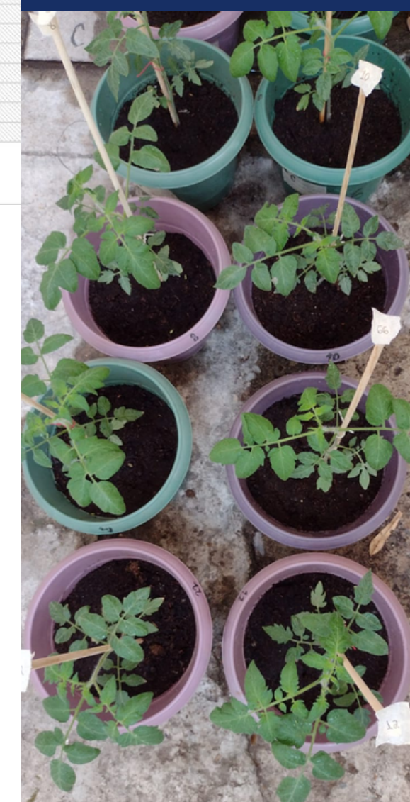
Figura 2. Plantas control de S. lycopersicum